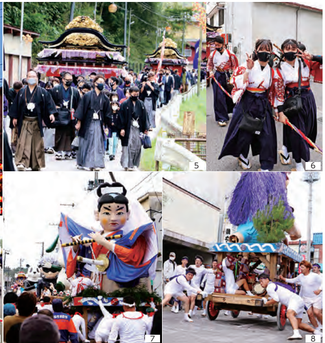
1～4_二本松の提灯祭り 5・6_小浜の紋付祭り 7・8_針道のあばれ山車