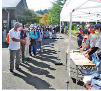
住民も参加した避難訓練

9月25日、ウッディハウスとうわグラウンドなどを会場に、東和地域防災訓練が実施されました。訓練には、13団体約180人の市民が参加し、震度6強の地震を想定しての避難訓練や応急救護訓練、救助・救出訓練、火災対応訓練などが行われました。