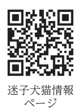
迷子犬猫情報ページ