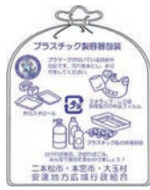
▲マークのついたきれいなプラスチック製容器包装の指定袋

マークの表示がついたプラスチック製容器包装は、透明の指定袋で資源ごみとして回収しています。