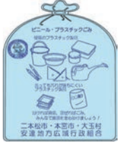
▲ビニール・プラスチックごみの指定袋

収集しているプラスチック製品に、汚れている物や紙・金属などのプラスチック製品以外のものが混入すると、資源化が困難です。汚れたものは、ビニール・プラスチックごみとして出してください。