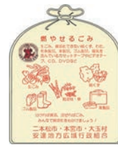
▲燃やせるごみの指定袋

ごみを出す場合は、指定された袋で出しましょう。無地のゴミ袋やレジ袋で出されたものは、収集できません。