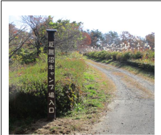
「キャンプ場入口」 こちらからご入場ください。