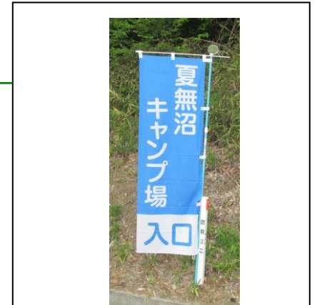
目印用の旗を立てて おります。