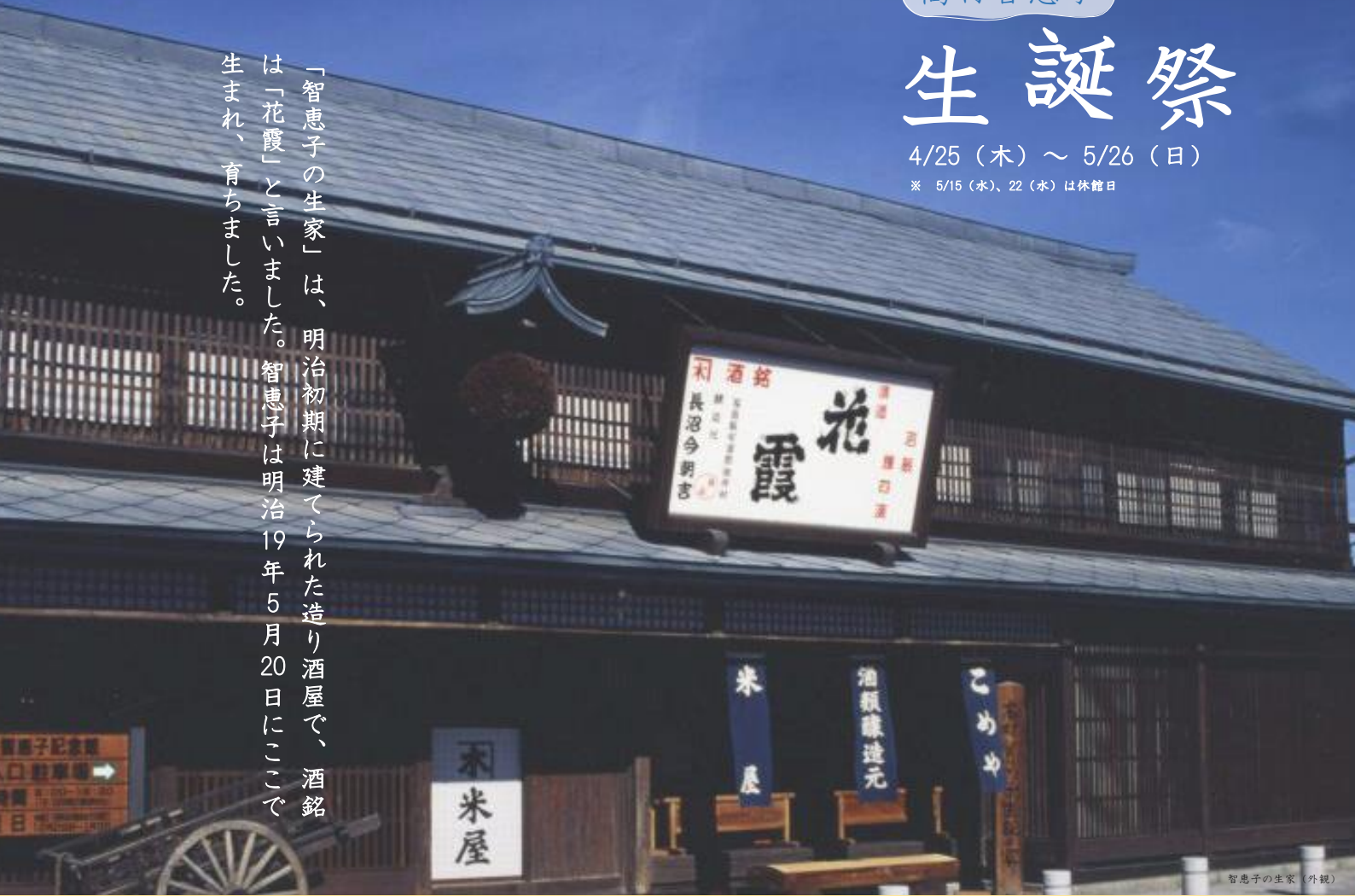
智恵子の生家（外観）

「智恵子の生家」は、明治初期に建てられた造り酒屋で、酒銘は「花霞」と言いました。智恵子は明治19年5月20日にここで生まれ、育ちました。