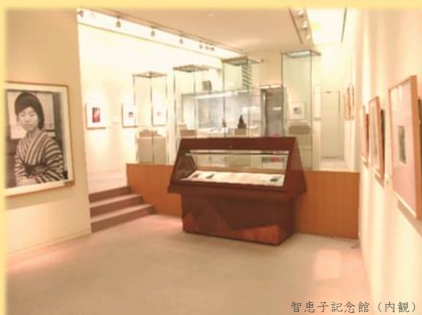
智恵子記念館（内観）