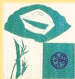
智恵子の紙絵作品「紋様」