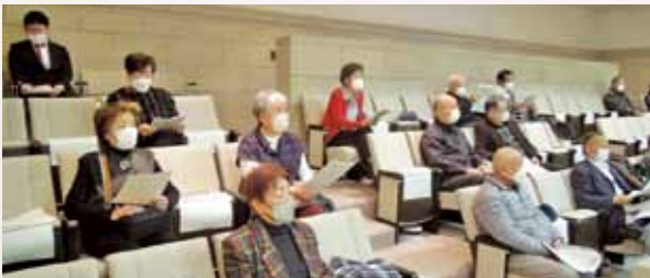
3月6日 一般質問を傍聴されたみなさん

全体としての感想は、自分と家族は二本松市に住んでいるのだが、その誰も知らない内容の政策が議会内で話し合われていることを知り、広報を別の形で行う、またはもう少し力を入れたり、市民の声を聴く必要があるのではないかと感じました。