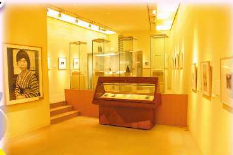
智恵子記念館(内観)

生家の裏庭にある記念館には「奇跡」と呼ばれる美しい紙絵や雑誌「青鞥」の表紙のデザインなどが収められています。明治、大正、昭和と激動の時代を生きた高村智恵子の愛と美の軌跡を是非ご覧ください。