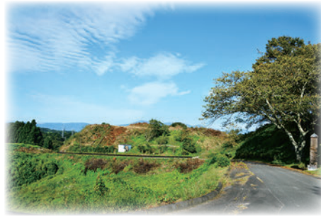
小浜城景観整備事業(令和4年度) (地域のシンボルである城跡の樹木を伐採して視覚を確保し、景観を整備)

この補助制度は、市民の方々の自治意識を高め、市民との協働によるまちづくりを推進するために、地域の社会的な課題に対して、市民自らが地域全体の視点に立ち、事業内容の検討、決定を行い、市民相互の支え合いと活力のある地域社会を創造することを目的としています。 市民の皆さんの豊富なノウハウを生かした、地域づくりのアイデアをご提案ください。