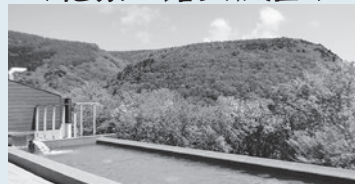
《あだたら山奥岳の湯》