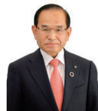
二本松市長 三保 恵一

これまでの成果を土台とし、「みんなで創る持続可能なまち」を柱として、イノベーションを興し、市民所得の向上と市民総生産の拡大、雇用の確保を図り、これからも力強く二本松市を成長させてまいります。