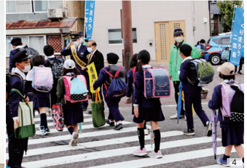
1～3_渋川小学校入学式 4_交通事故防止運動街頭指導(二本松南小通学路)