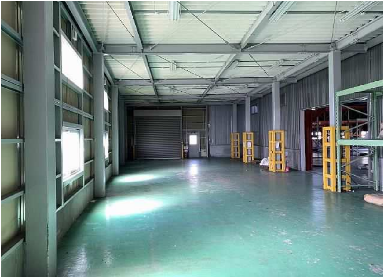
建屋 附②倉庫 北側（増築部）