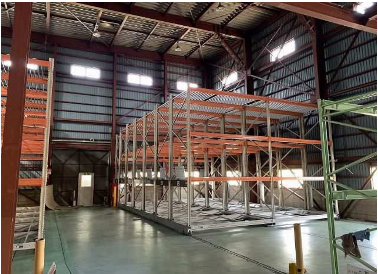
建屋 附②倉庫 東側（屋根高箇所）