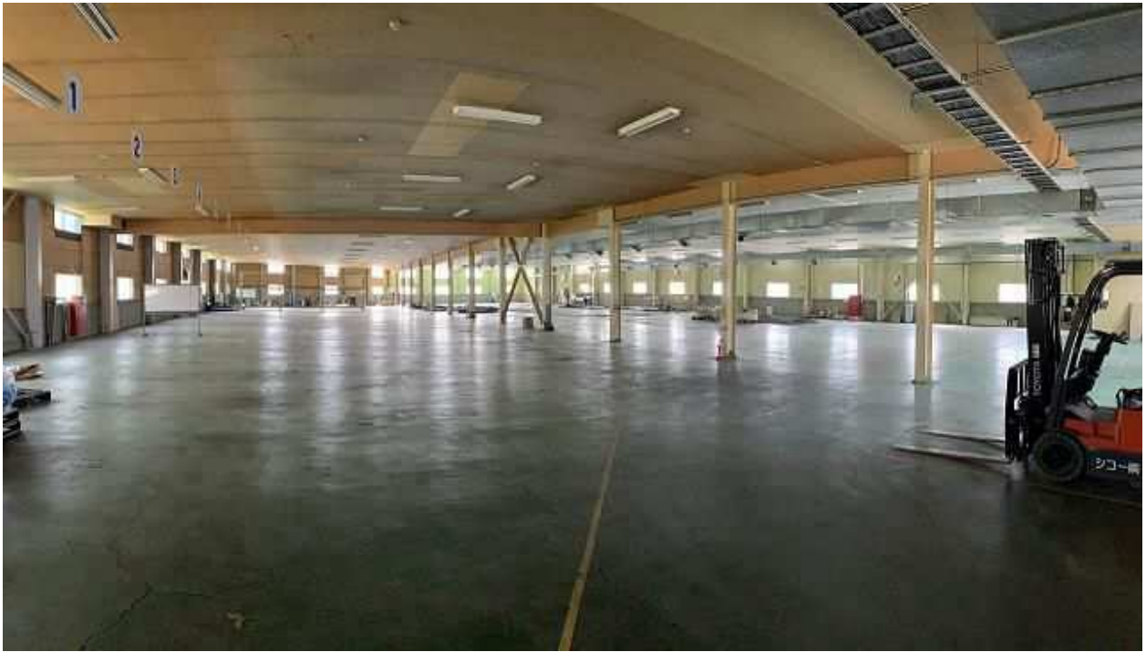
建屋 附①工場（第2工場）