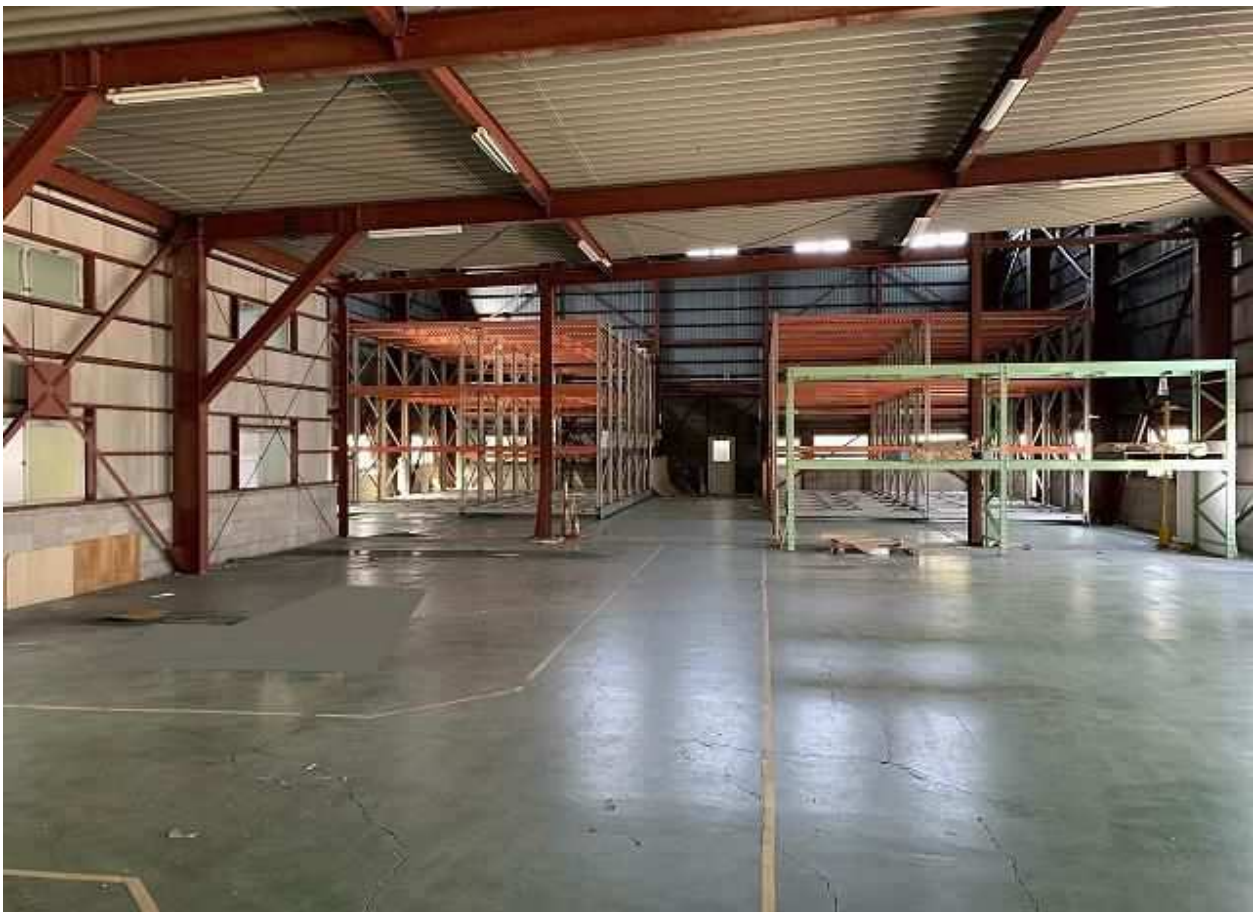
建屋 附②倉庫 西側