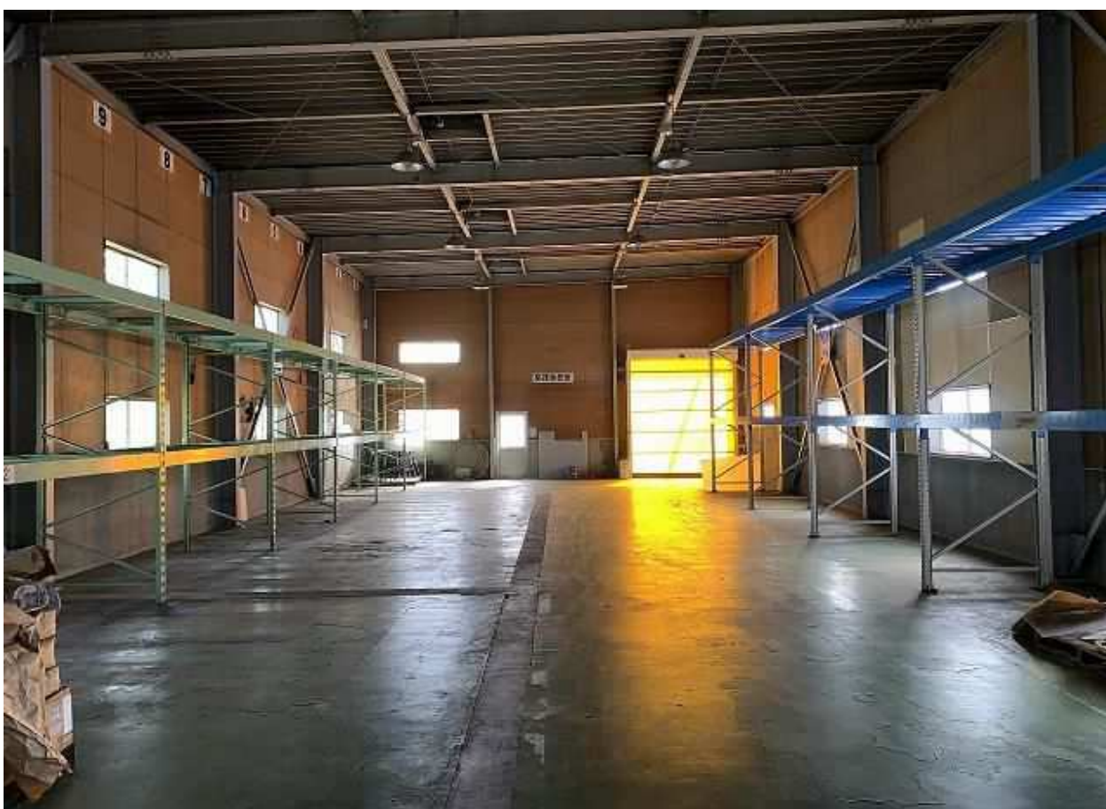
建屋 (主) 西側 倉庫部