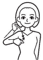
親指を人差し指にのせた右手拳で首筋を煽ぐように動かす。