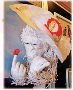
昨年の最優秀賞 「こんにちわ」

道の駅「安達」ウェブサイトおよび二本松市和紙伝承館または安達支所地域振興課に備え付けの応募用紙に必要事項を記入の上、作品と合わせて応募先へ送付または持参してください。