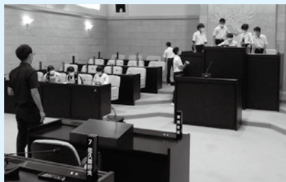
二本松第一中学校のみなさん

7月12日に二本松第一中学校、同月14日に二本松第三中学校、8月25日に二本松第二中学校が職場体験の一環として議場を見学しました。議会に関心を持ってもらえるよう議会のしくみなどを説明し、議長席や当局席に座ることで議会の雰囲気を感じてもらいました。