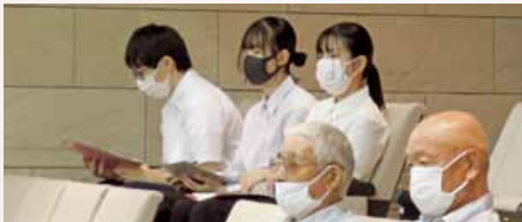
インターンシップの学生のみなさん