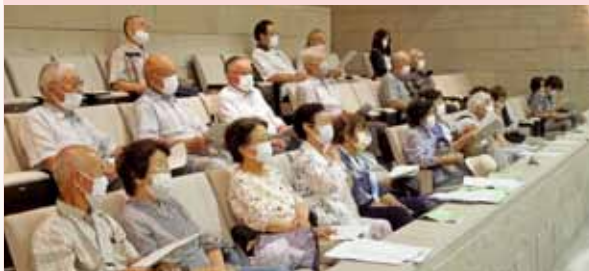
塩沢寿学級のみなさん

当たり前のように過ごしている日々の暮らしは、議会や市当局、多くの団体、市民の活動によって支えられていることに改めて気づかされました。私たちはもっと市政に関心を持ち、参加していくことが大事だと思います。