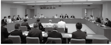
決算審査特別委員会の様子

議案などを専門的、合理的、能率的に審査する常設の常任委員会のほかに、特定事件を審査するために特別委員会を設置することができます。9月定例会では、令和4年度各会計決算を審査するため、決算審査特別委員会を設置しました。9月13日及び14日に、全体会で机上での総括審査を行った後、分科会に分かれ質疑・討議が行われました。