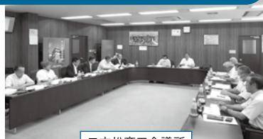
二本松商工会議所

所管事務調査の一環として、市民の皆様などから意見を聴くことを目的に、各団体と懇談会を行いました。