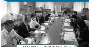
一般社団法人岳温泉観光協会