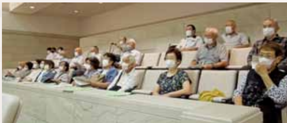
9月7日 9月定例会を傍聴されたみなさん