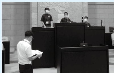
二本松第二中学校のみなさん