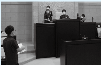
二本松第三中学校のみなさん