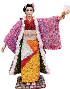
上川崎の和紙菊で 作られた菊人形

どこへ行く家康? 二本松と所縁の深い家康。秋の二本松は見どころがいっぱい。ようこそ二本松へ! 皆様のお出でをお待ちいたしております。