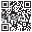
県議会議員選挙について