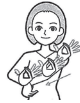
左上腕に右手甲をつけ親指と4指を開閉しながら腕を滑り下ろす (出典：一般財団法人全日本ろうあ連盟「わたしたちの手話 学習辞典1」)