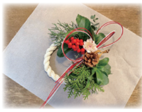
画像はイメージです