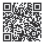
国税庁ホームページ