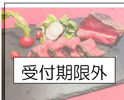
13二本松市産黒毛和牛ローストビーフ450g

黒毛和牛ローストビーフ450g(2本 合計) ※ローストビーフソース、レフォール、 わさび塩付きです。製造後急速 冷凍しております。