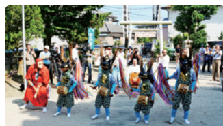
熊川稚児鹿舞保存会