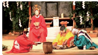
蚕養舞(白鳥神社太々神楽保存会)