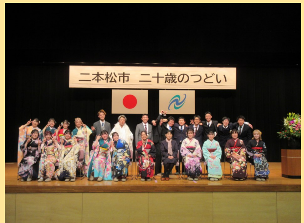
岩代中学校卒業生の皆さん