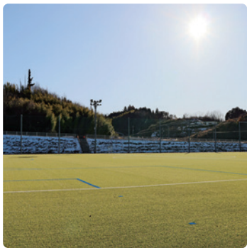
▲人工芝コート内1面は夜間照明を完備

岩代地域に整備を進めてきた「二本松市グリーンフィールド」が完成しました。人工芝のコート2面は日本サッカー協会（JFA）公認のサッカー場としての機能を持ち、その他のアップコート1面と天然芝の広場など多くの方々が活用できる運動施設です。