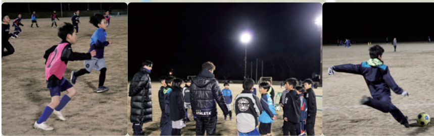
▲あだちJFCの練習の様子。寒風吹きすさぶ中でも、元気に声を出して練習に取り組んでいました。

開催できるようになることなど期待を寄せています。今後、スポーツやイベントを通じた交流人口の増加や、それに伴う地域経済の発展など、二本松市全体の活性化につながる施設になることが期待されます。