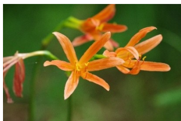
キツネノカミソリ