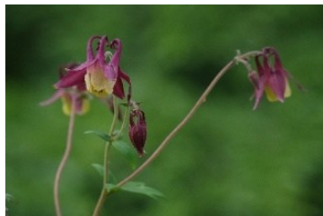
オオヤマオダマキ