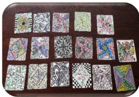
小浜セミナーの皆さんの作品