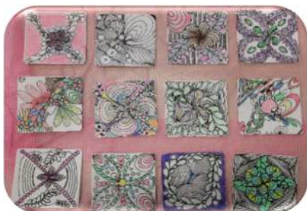
新殿セミナーの皆さんの作品