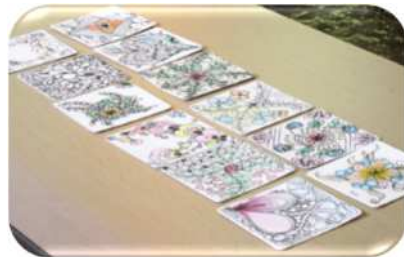
旭セミナーの皆さんの作品