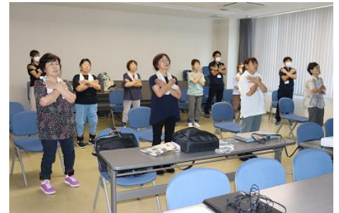
いきいき百歳体操

サークルの名称は、健康教室の名称から“しゃんしゃん”と、行った体操が“いきいき百歳体操”なので、百歳までしゃんしゃんでいられるように「 しゃんしゃん百歳 」に決めました。