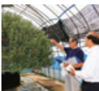
9月上旬に「千輪咲」の生育状況を確認してきました。

努力を称えながら「より多くの花を咲かせて、菊人形の来場者に夢と感動を与えてほしい」という思いを込めて、挑戦を続ける「千輪咲」を応援してまいります。