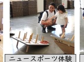
ニュースポーツ体験「輪投げ」