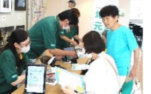
健康モニタリング