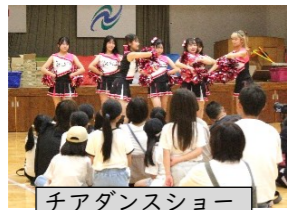
チアダンスショー