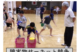
障害物サーキット競争