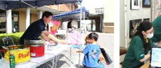
お子様へ参加賞進呈