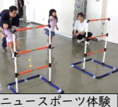
ニュースポーツ体験「ラダーゲッター」