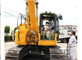
「バックホー」乗車体験