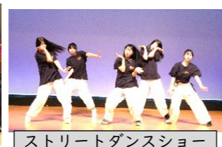
ストリートダンスショー