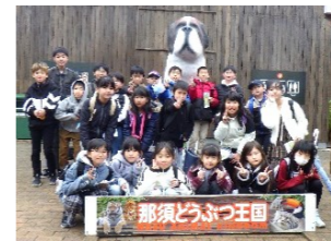
那須どうぶつ王国

第6回あだちチャレンジ教室が11月9日(日)に開催され、22名が参加しました。那須どうぶつ王国では餌付け体験や動物ショーを楽しみ、