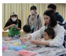
カラーソルトアート