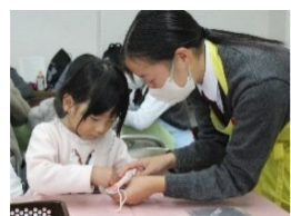
クリスマスリース作り