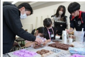
ペーパーウェイト作り