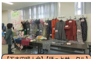
【下太田婦人会】【ほっとサークル】 手芸品 リメイク服