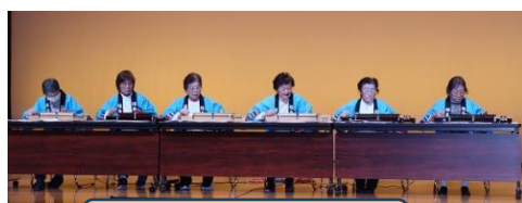
【大正琴なでしこ東和教室】