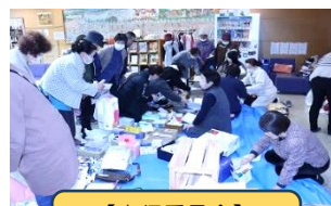
【実行委員会】 フリーマーケット