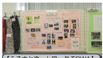
【ふるさとネットワーク TOWA】 活動報告