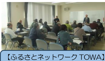
【ふるさとネットワーク TOWA】 講演会「東和史を紐解く 第3弾 近世史」