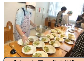
【ネットワーク玄米】 料理教室&試食会