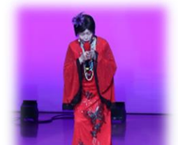
【H.S.L】 カラオケのど自慢