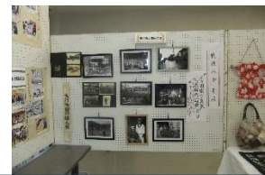
【東和郷土史研究会】 活動報告・戦後80年展