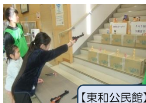
【東和公民館】 こども縁日