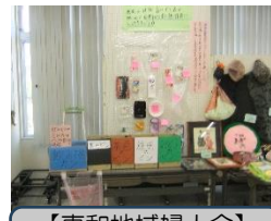
【東和地域婦人会】 ゴミの分別展示