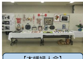
【木幡婦人会】 パッチワーク、切り絵等