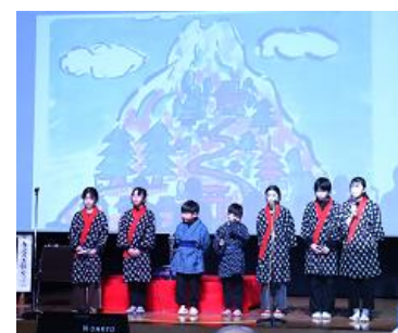
【にほんまつ民話を語ってみっ会】 東和小学校児童の皆さん