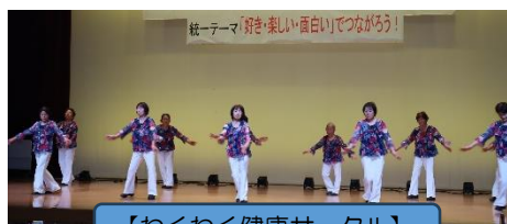
【わくわく健康サークル】

2月14日(土)と15日(日)、東和文化センターで『第27回東和公民館まつり』が開催されました。統一テーマとして、「好き・楽しい・面白い」でつながろう！を掲げ、各種サークル等が日頃の成果を披露、天候にも恵まれ、多くの皆様にご来場いただきました。