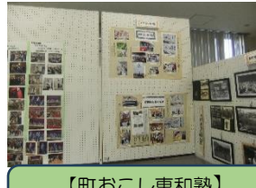
【町おこし東和塾】 活動報告