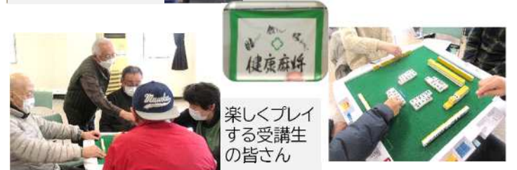
楽しくプレイする受講生の皆さん