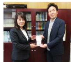
騎西校長先生と大内会長