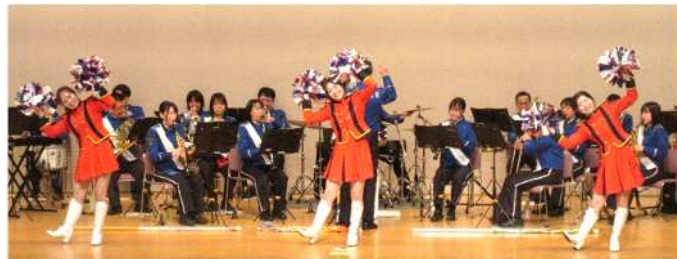
県警音楽隊の皆さん