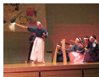
1学年 少年隊の演技