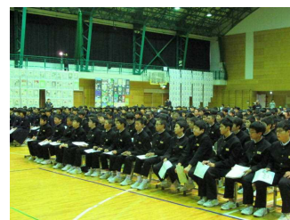
開祭式(後方は展示作品)