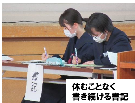
休むことなく 書き続ける書記