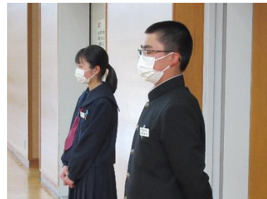
賛成の拍手を確認する役員