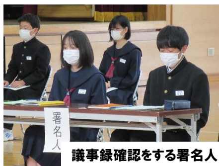
議事録確認をする署名人