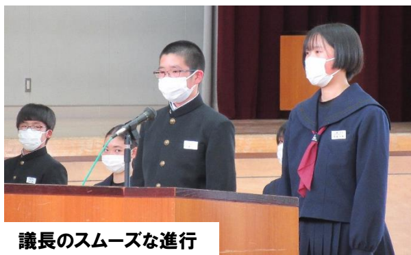
議長のスムーズな進行