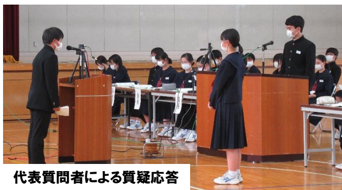
代表質問者による質疑応答