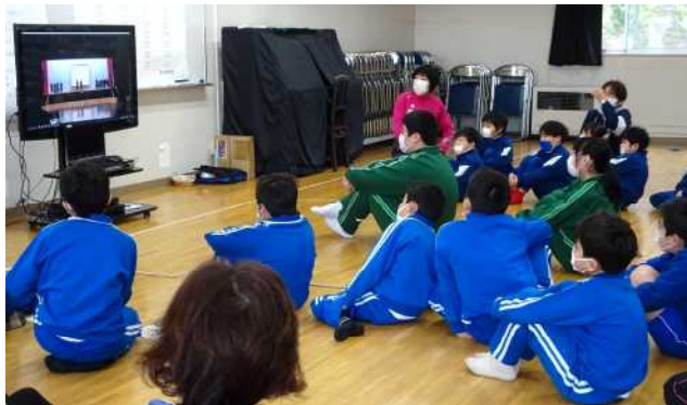
中学校の文化祭の動画を見て、中学生へのあこがれが高まります。