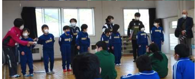
各校の児童・生徒一人一人の自己紹介。期待感が高まります。

まずは、「いっしょに やってみよう」によるウォーミングアップです。「どっちが好き？」で、好みはそれぞれ違うことを認め合い、続いて「おちた おちた」のゲームを楽しみました。