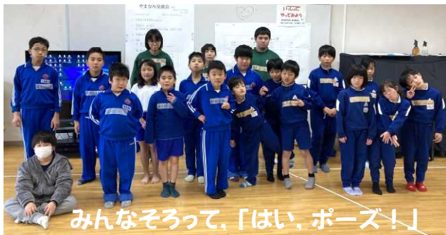
みんなそろって、「はい、ポーズ！」